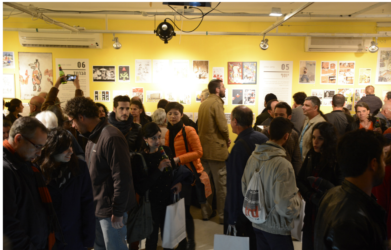
עדין אופטימיים 120 אמנים מציירים דודו גבע