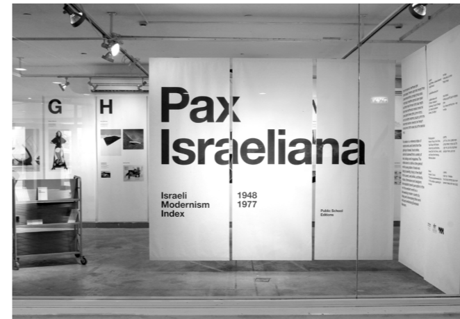
פקס ישראליאנה אסף כהן וג'ואנה אסרף