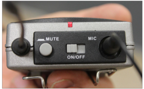
▲ כשכפתור ההדלקה דולק, הנורית באדום