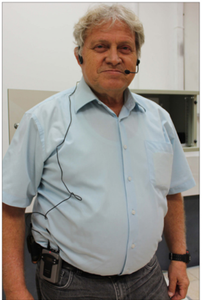
▲ כך שמים את המיקרופון