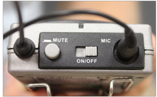
▲ מראה המסדר מלמעלה