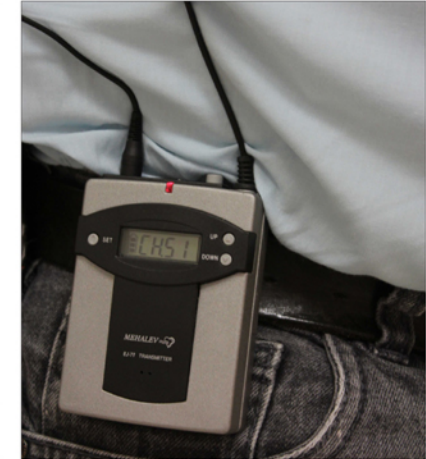
▲ לשים את המסדר בחגורה