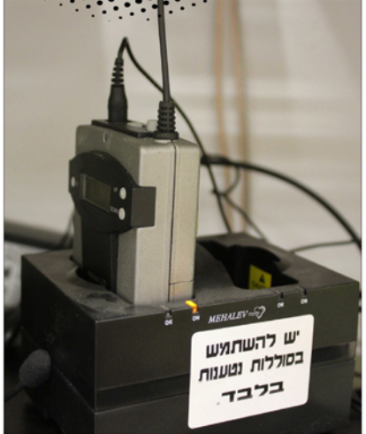
▲ ערכת המיקרופון והמסדר