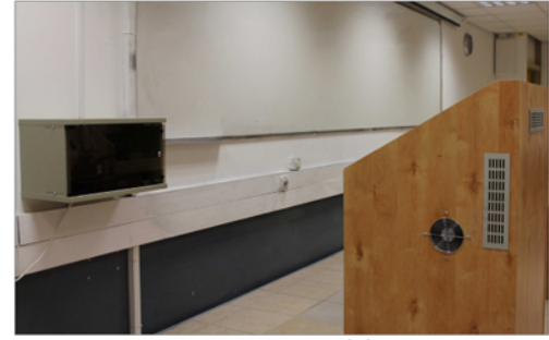
▲ מראה כללי עמדה + ארון הגברה