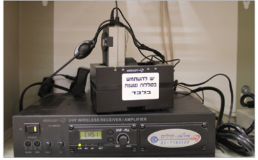
▲ מראה כללי של הארון פנימה