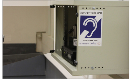
▲ ארון הגברה פתוח